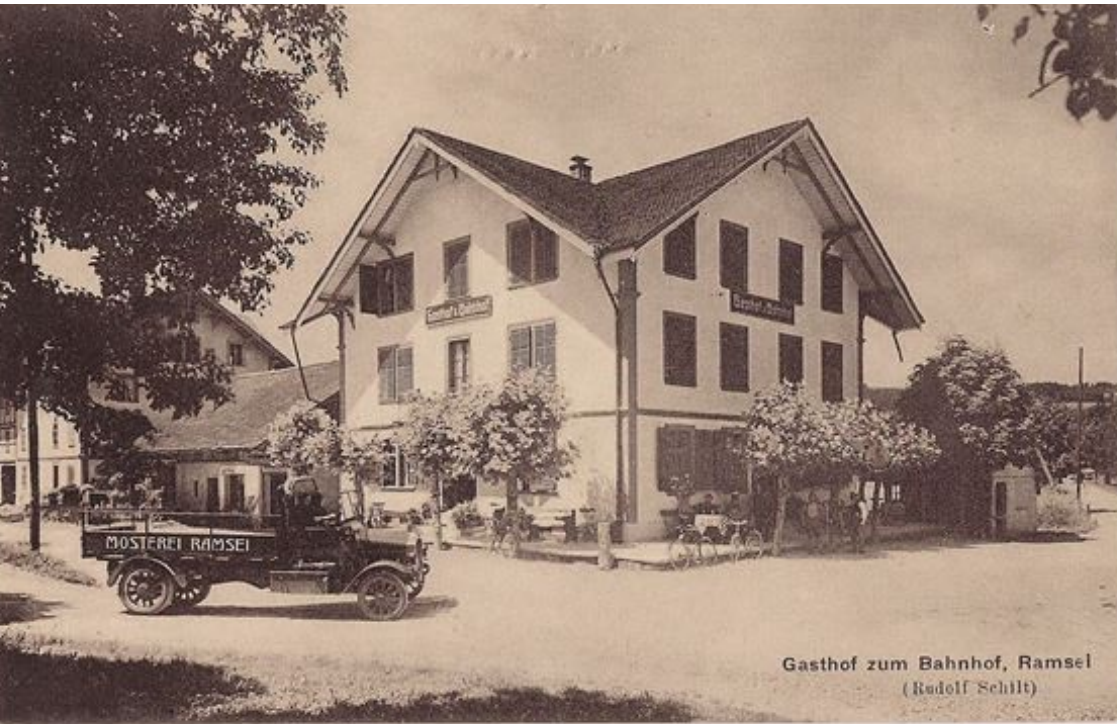
Gasthof zum Bahnhof, Ramsei (Rodolf Schilt)